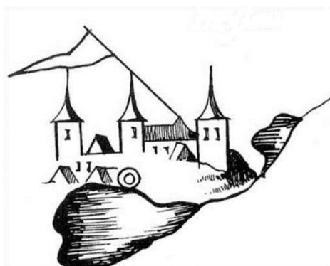
Малюнак Томаша Макоўскага

Замак, як відаць, быў вялікі. (Магчыма, на гары былі нават два замкі.) Знешні выгляд будынка можна прыкладна ўявіць па малюнку Томаша Макоўскага, зробленым больш за 400 гадоў таму. І хоць на ім не перададзены дэталі, усё ж можна ўбачыць агульныя абрысы збудавання.